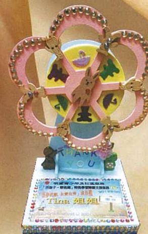
學生親手製作的禮物，以表示對義工的謝意。

由「活孩子、樂爸媽」特殊學習障礙支援服務成立至今，「愛心義工團隊」一直都默默地支持著服務裡的學障孩子。正如Tina所說，團隊所提供的並非只是純粹的補習服務，而是會關顧他們成長上不同環節的需要。他們明白到要有效的幫助學障學生，不是不斷要他們追趕學業成就，而是應該要整全地了解他們的需要，協助他們發展多方面的能力和才華，確立他們健全的人格。義工服務讓受助者和義工都一起成長，發揮彼此潛能，回饋社會！