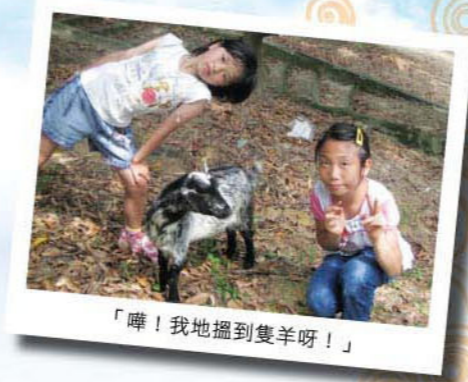
「嘩！我地搵到隻羊呀！」