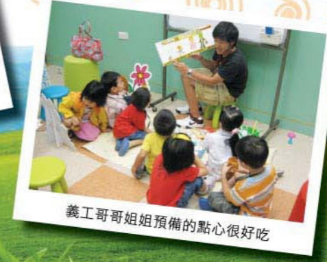
義工哥哥姐姐預備的點心很好吃