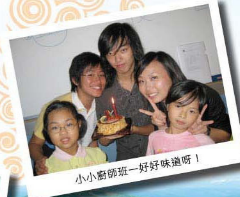
小小廚師班—好好味道呀！