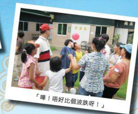
「嘩！唔好比個波跌呀！」