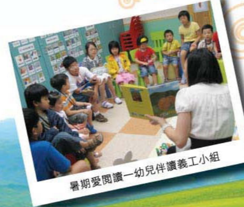
暑期愛閱讀—幼兒伴讀義工小組