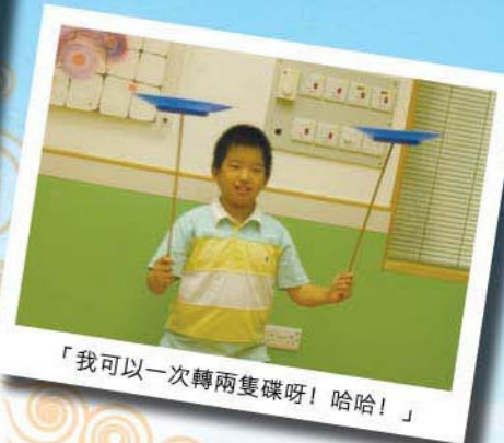
「我可以一次轉兩隻碟呀！哈哈！」