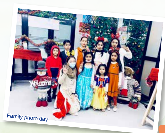
Family photo day

Remarks: All participants should be Caritas Members.