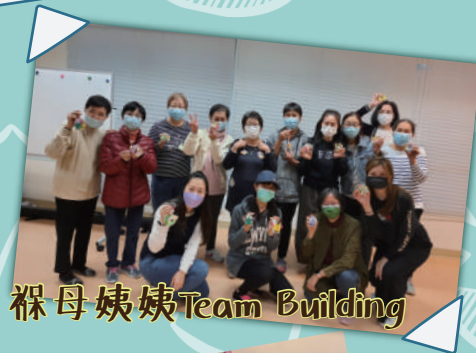
裸母姨姨 Team Building