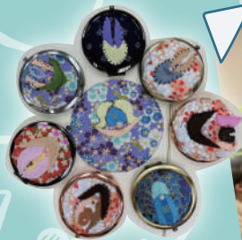
性教育工作坊： 外陰鏡盒製作