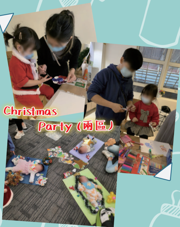
Christmas Party (兩區)