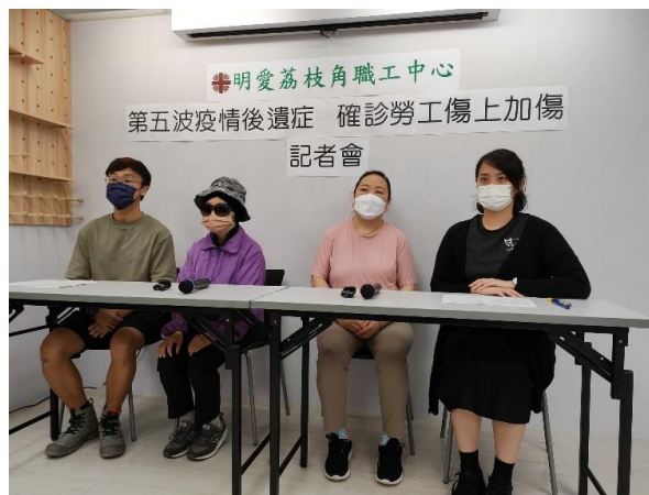
明愛荔枝角職工中心今日發表勞工「傷上加傷」調查報告結果。

第五波疫情期間確診個案超過 120 萬，最嚴峻時醫院及社區隔離設施不勝負荷，確診者只能居家隔離，基層勞工卻深受其害。有關團體發表勞工調查報告，發現曾確診或須隔離受訪者中，多達 91.5% 未獲有薪病假，近五成確診受訪者家庭收入減幅高達六成以上，其中六十多歲外判清潔女工確診及復陽兩度停工，康復後向公司遞交隔離令只獲批最多七日有薪病假，薪金卻率先被扣減，連之前聲稱有薪病假仍未獲發還，勞工處答覆亦模稜兩可，令她求助無門，中心指至少接獲 10 宗染疫工人未能取得康復碼的求助，否則只能面對解僱或提早打第三針的抉擇，促請政府檢視。