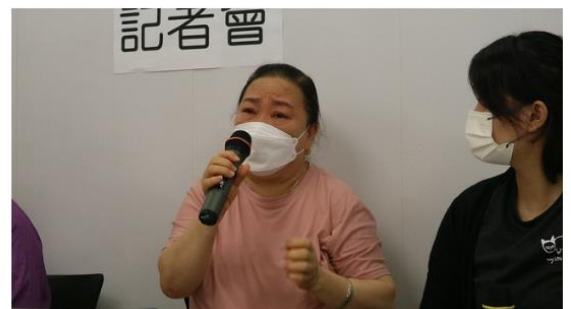
亞紅發言時一度抽泣

https://www.inmediahk.net/node/%E5%8B%9E%E5%B7%A5/%E6%98%8E%E6%84%9B%E8%AA%BF%E6%9F%A5%EF%BC%9A%E9%80%BE%E4%B9%9D%E6%88%90%E5%9F%BA%E5%B1%A4%E5%8B%9E%E5%B7%A5%E6%9F%93%E7%96%AB%E6%88%96%E9%9A%94%E9%9B%A2%E6%9C%AA%E7%8D%B2%E6%9C%89%E8%96%AA%E7%97%85%E5%81%87-%E5%80%A1%E6%94%BE%E5%AF%AC%E6%81%A9%E6%81%A4%E6%B4%A5%E8%B2%BC