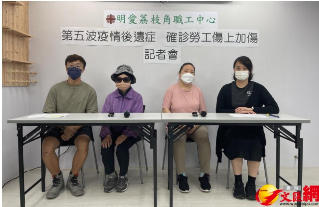
明愛荔枝角職工中心一項調查顯示，不少確診基層勞工未能得到有效支援。

（大公文匯全媒體記者 李斯哲）香港第五波疫情令許多染疫基層勞工手停口停，收入大減。明愛荔枝角職工中心今日（10日）發布的一項調查顯示，在195位受訪勞工中，82位曾確診或需隔離的受訪者，有七成三表示收入受到影響，超九成人未能獲得有薪病假，其中逾半是因為沒有固定僱主或工時不足，而全部受訪確診者都未符合政府為住院人士提供的5000元一次性津貼。中心希望政府在之後的疫情中，擴闊受惠者至其他需隔離的勞工，讓有需要家庭能夠得到適切援助。