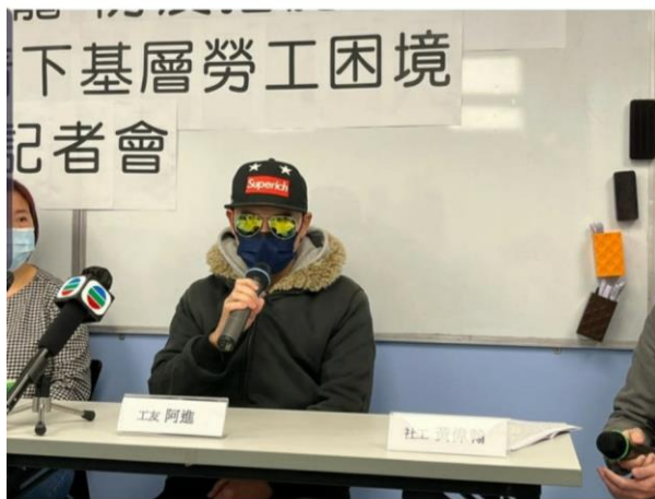
43歲的取得由政府開出可豁免接種疫苗的醫生紙，但僱主仍然要求所有員工必須接種疫苗，因此阿進工作至上月底便遭解僱。