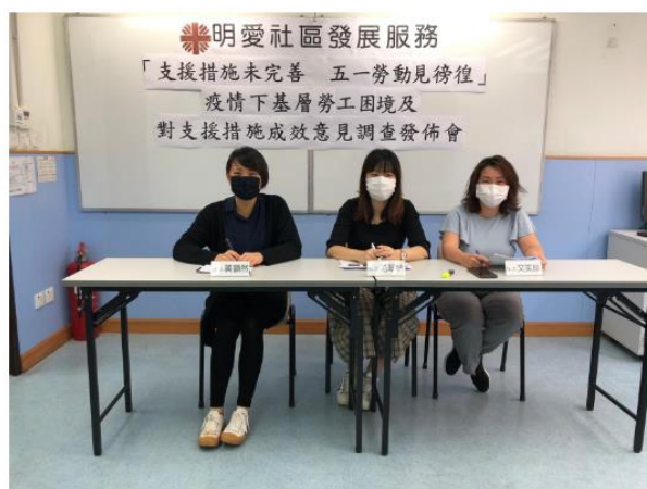
明愛社區發展服務一項調查發現，73%基層勞工未在港府的防疫抗疫基金中受惠。(受訪者提供)