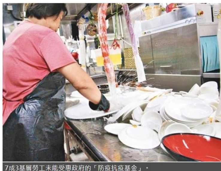
7成3基層勞工未能受惠政府的「防疫抗疫基金」。

新冠肺炎疫情影響各行各業，不少勞工面臨就業不足、失業等問題。明愛社區發展服務今（29日）指今年3月尾至4月中訪問基層勞工，超過7成3基層勞工未能受惠政府的「防疫抗疫基金」，當中大部分從事飲食業及零售業，調查提出建議職津需要取消與工時掛鈎的要求。